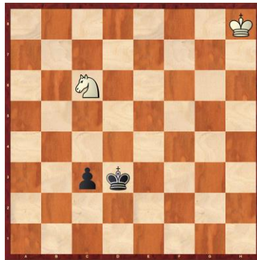
F1-2: Weiss am Zug