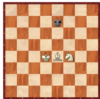
F1-12: Schwarz am Zug

Fragestellung: Welches sind die ‚richtigen‘ Resultate dieser Stellungen? Zeige warum.