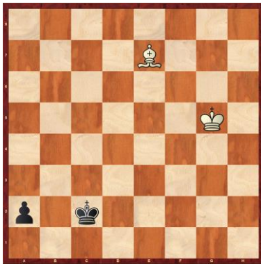
F1-1: Weiss am Zug