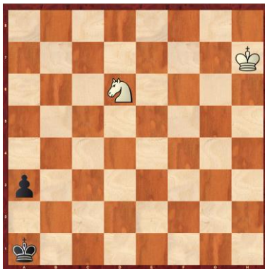
F1-4: Schwarz am Zug