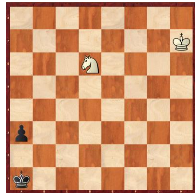
F1-3: Weiss am Zug