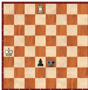
F1-8: Weiss am Zug