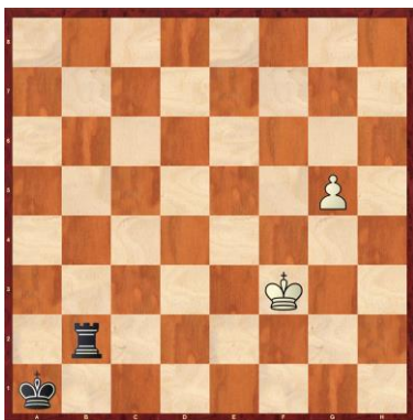
F1-7: Weiss am Zug