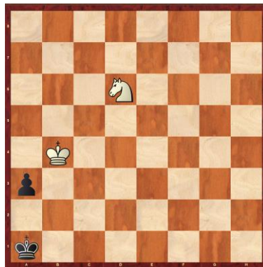
F1-5: Schwarz am Zug