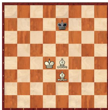
F1-11: Weiss am Zug