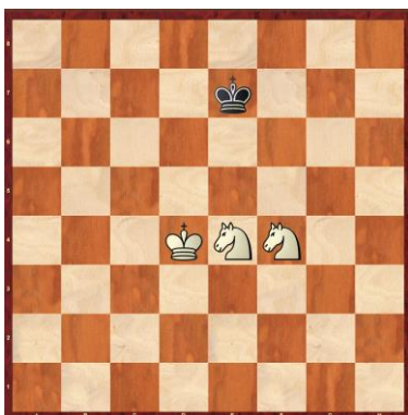
F1-10: Weiss am Zug