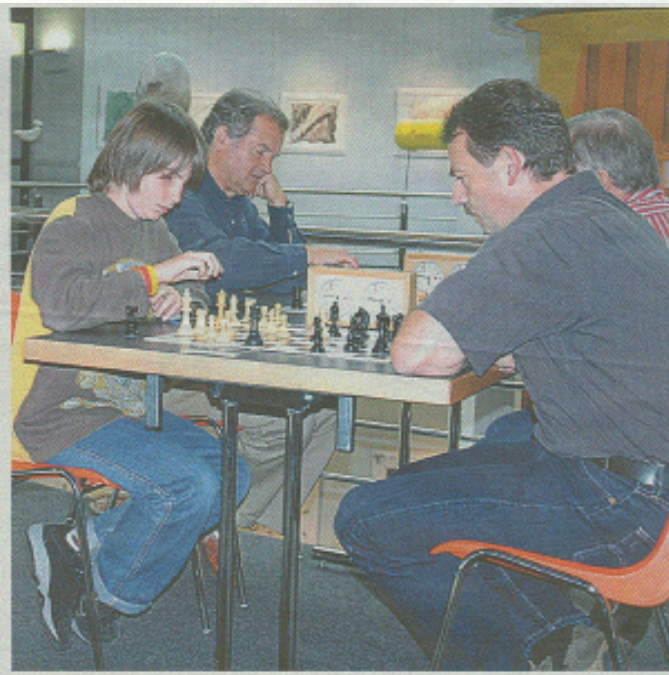
Das Schachspiel verbindet Generationen.

Viertes Kühlturm-Schachturnier des Schach-Clubs Döttingen-Klingnau und Umgebung