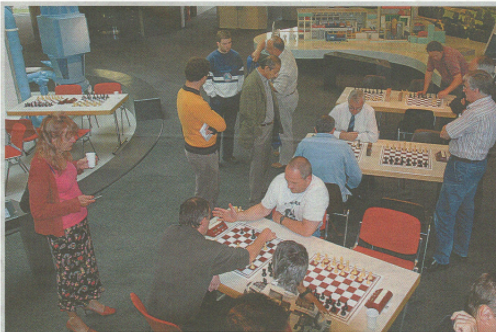
Interessiert werden die spannenden Partien mitverfolgt.